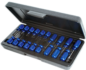
Terminal Tool Set | 4027