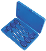
Terminal Tool Kit 6pc | 3984